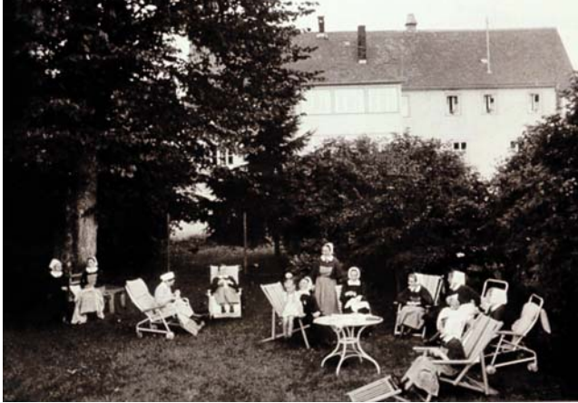
Altenhilfezentrum „Im Olgagarten“, Steinheim