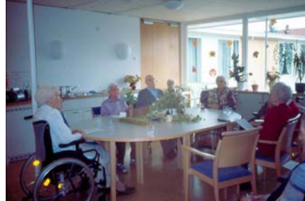
Wohn-/Essraum mit Küchenzeile

Altenhilfeeinrichtung „Im Olgagarten“, Steinheim